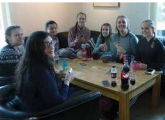
Når det ble for kaldt ute, var det nok å finne på inne.

elevene hadde godt humør og viste at de var i stand til å kle seg etter været. En dag var det så kaldt at det i kombinasjon med vind på toppene kunne føles som ned i -40°C, og da ble alle skitrekene stengt. Men det var ingen sure miner av den grunn, og alle fant på noe å gjøre enten ute eller inne. Her er noen glimt fra leirskolen til 1ST og 1EL.