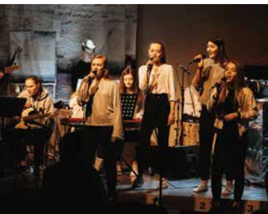
9. trinn stilte med eige band og solistar under revyen.

I starten møter me hovudpersonane Frida, Viggo og Lasse, som diskuterer kven som har det finaste ansiktet. Ei jente som heiter Sofie klarer å endra på verdimaskinen slik at den berre viser verdien på ansikt. Då får ho får eit høgare tal enn andre, og ho kjenner seg veldig bra. Me får vera med på eit par rundar gjennom nokre av kategoriane, før tre agentar kjem og stiller verdimaskinen inn på «menneskeverd», då får alle full pott, 10 poeng (dette skal gangast med 7, sidan menneskeverdet er mykje viktigare enn alle dei andre kategoriane). Frida og Lasse liker ikkje dette, og endrar maskinen til «popularitet», slik at dei sjølv får høgast verdi. Ei blind jente som heiter Beate vil fiksa det, men ho er uheldig og endrar maskinen til «minste verdi». Alle innbyggjarane får berre vist den kategorien der dei har minst verdi, alle mistar sjølvtiliten, og sjølv om dei er veldig usikre, blir dei samde om å stilla verdimaskinen inn på «sum». Det viser seg då at når alle summene og menneskeverdet blir lagt saman, har alle ein sum på 100. Men agentane avsluttar med å seia at folka ikkje skal vera opptekne av alle poenga sine (dei ber poenga på eit skilt på brystet). Når folka snur skilta sine, finn dei sine eigne namn, og alle får vera seg sjølv.