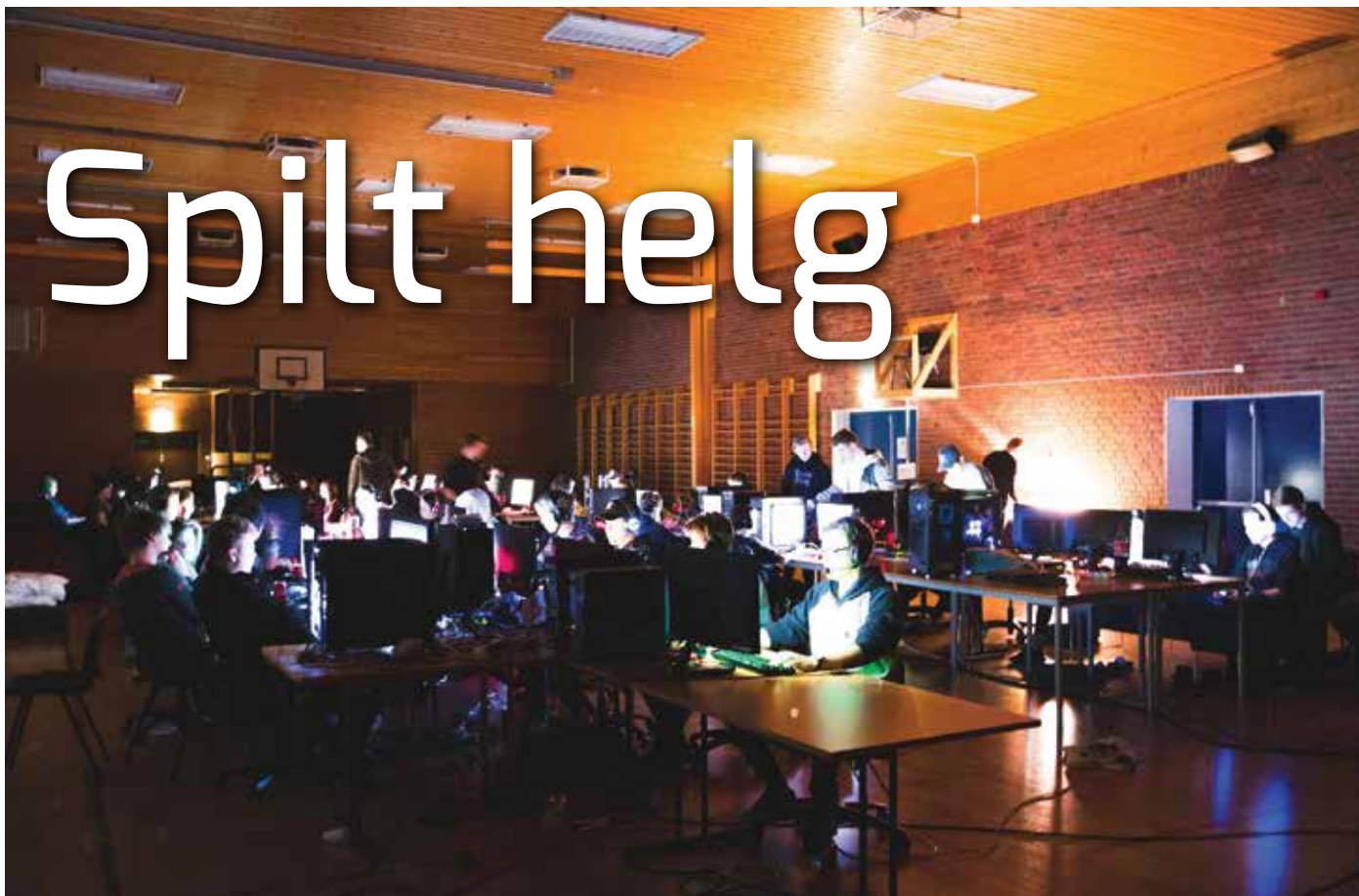
Elever satt i dyp konsentrasjon foran PC-skjermene sine i gymsalen.

■ Tekst: Henrik Foss