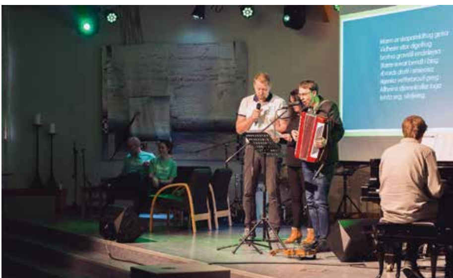
Det var urframføring av salmen «Skapinga».