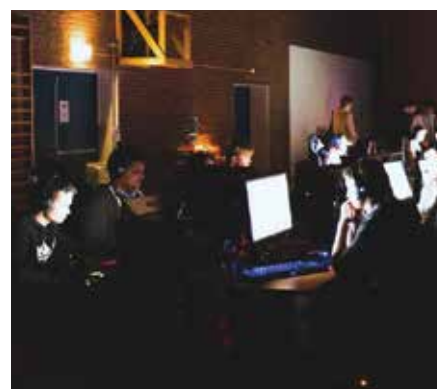
Elever trimmet hjernen i gymsalen.