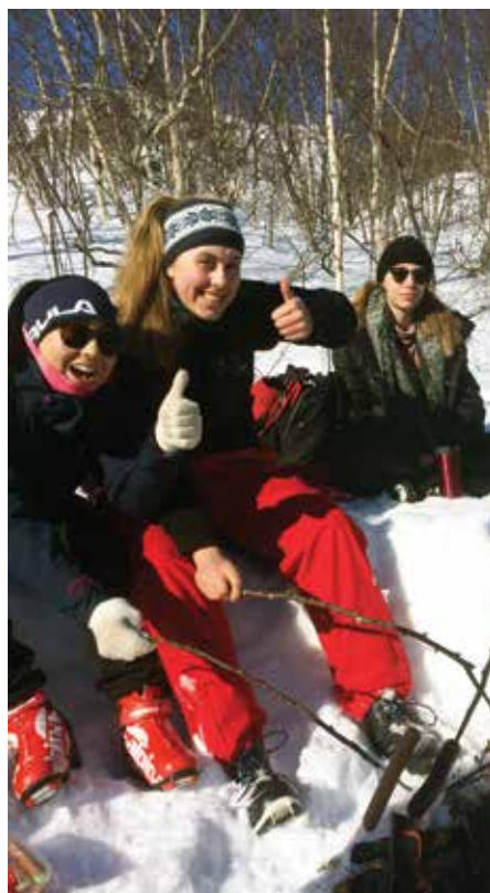
Klart for bålsteke pølser.