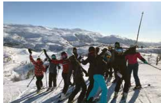
Slalåmgjengen er klar til å sette utfor.