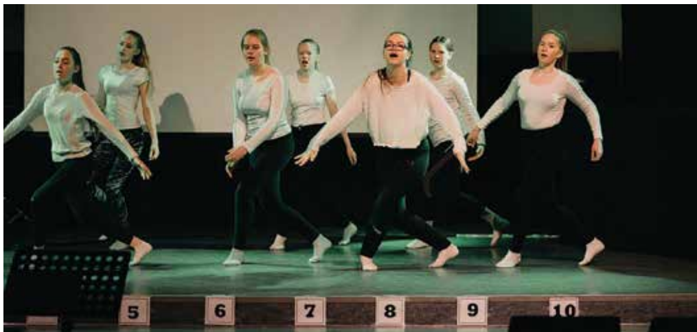
Dansegruppe under revyen.