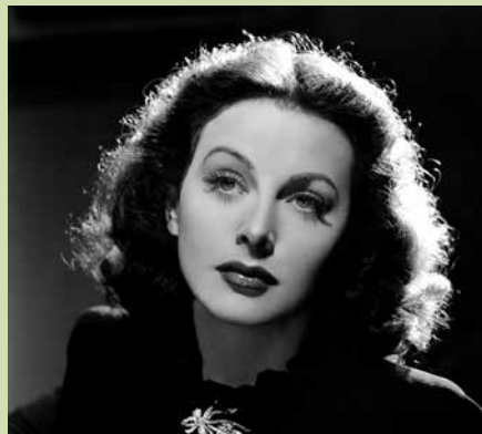
Hedy Lamarr (født Hedwig Eva Maria Kiesler, 1914–2000) – pionér innen internett og mobiltelefoni

Blodgett var en amerikansk fysiker og kjemiker som fant opp teknologien som gjør briller, kameratelefoner og telefonskjermer klarere ved å redusere gjenskinnet. Gjennom forskningen sin utviklet hun verdens første molekylært tynne, ikke-reflekterende belegg, ofte kalt «usynlig glass». Dette var en avgjørende innovasjon for moderne optikk. Under andre verdenskrig ble Blodgetts ikke-reflekterende linser brukt i ubåtperiskoper og spionkameraer i fly. Filmverdenen har også nytt godt av hennes forskning: Filmen «Tatt av vinden» (1939), kjent for sin usedvanlig klare kinematografi, var den første store filmproduksjonen som brukte Blodgetts usynlige glass. Men bidragene hennes til vitenskapen har historisk sett blitt minimert siden hun var kvinne.