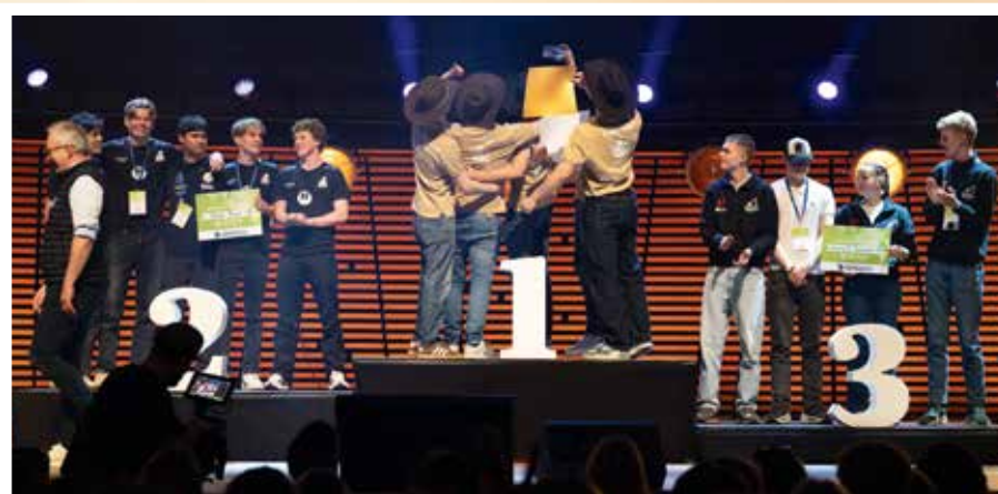
Tryggheim tapetserte seierspallen også i kategorien innovasjon. Graving og Transport UB fra anleggsteknikk kom på tredjeplass, Bench Buddy UB fikk sølvplass, og FjosFalken UB ble kåret til Rogalands mest innovative ungdomsbedrift.