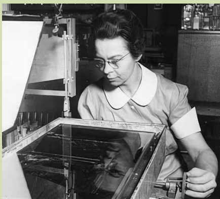
Katharine Burr Blodgett (1898 – 1979) – pionér innen moderne optikk

Her er tre kvinner som heller aldri fikk noen nobelpris, men som fant opp saker og ting vi alle har bruk for og har stor glede av i dag.