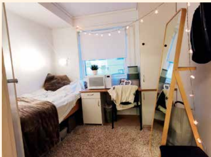
Den kristne friskulen KVS Lyngdal har brukt ei liknande løysing som Tryggheim skal få. Slik ser internatromma ut.