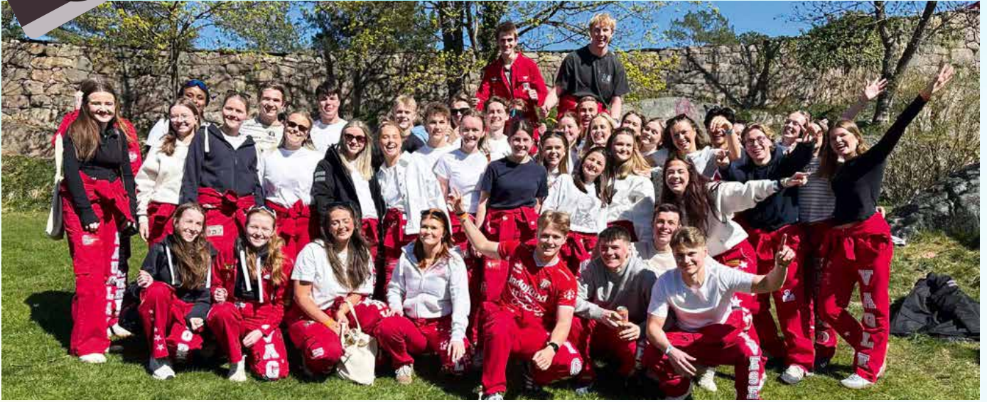
Ca. 40 Vg3-elever fra Tryggheim deltok på treffet i Kristiansand i regi av Kristenrussen fra fredag 24. til søndag 26. april.