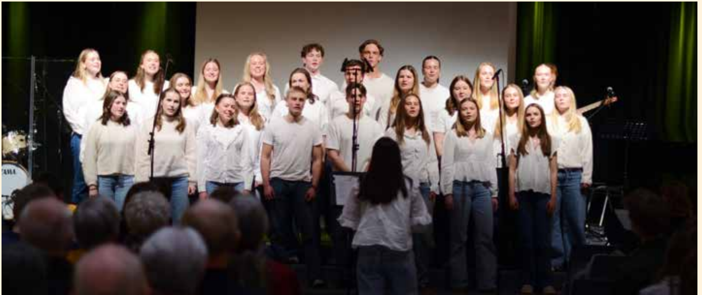
Russekoret deltok med song både på huslydkvelden og på samlinga for heile vidaregåande før påske.