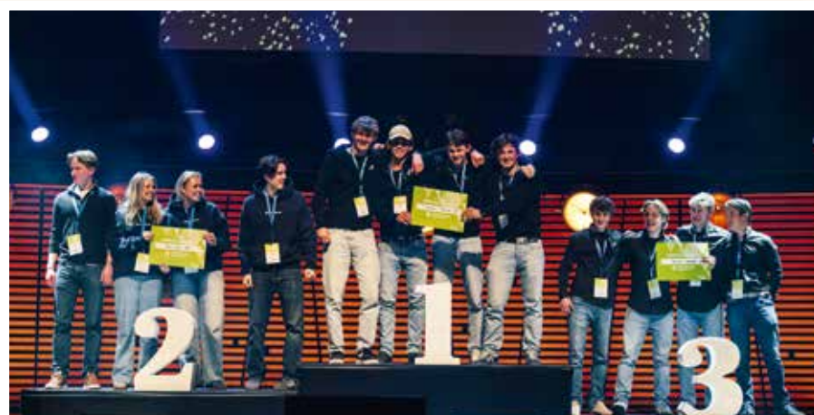
Tryggheim tapetserte seierspallen i kategorien beste salgsbedrift. Royal Design UB (t.h.) fra tømrer kom på tredjeplass, Beloved UB fra studiespesialisering og påbygg fikk andreplass, og Trofast Design UB fra tømrer ble kåret til superselgere.