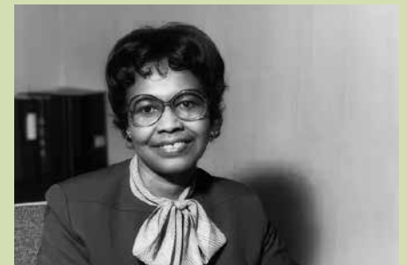
Gladys Brown West (1930 – 2026) – pionér innen navigasjonssystemet GPS

Lamarr var en østerriksk-amerikansk filmskuespiller og oppfinner. Selv om hun er mest kjent for sin filmkarriere, hadde hun også en viktig forskerkarriere. Hun var blant annet med på å utvikle en forløper til dagens WiFi-nettverk, blå-tann-teknologien og mobiltelefoni. Under 2. verdenskrig kom hun på den unike ideen om frekvenshopping, noe som i dag er helt nødvendig for at mange skal kunne kommunisere i samme frekvensområde uten å bli avlyttet eller forstyrret av hverandre. Den gangen ble oppfinnelsen hennes brukt til å holde radiokommunikasjon hemmelig, spesielt slik at styring av torpedoer fra undervannsbåter ikke skulle oppdages.