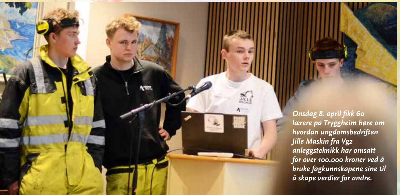
Onsdag 8. april fikk 60 lærere på Tryggheim høre om hvordan ungdomsbedriften Jille Maskin fra Vg2 anleggsteknikk har omsatt for over 100.000 kroner ved å bruke fagkunnskapene sine til å skape verdier for andre.