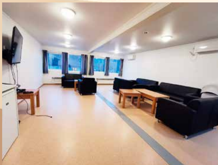
Det åttande internatet på Tryggheim får liknande stove som på KVS Lyngdal.