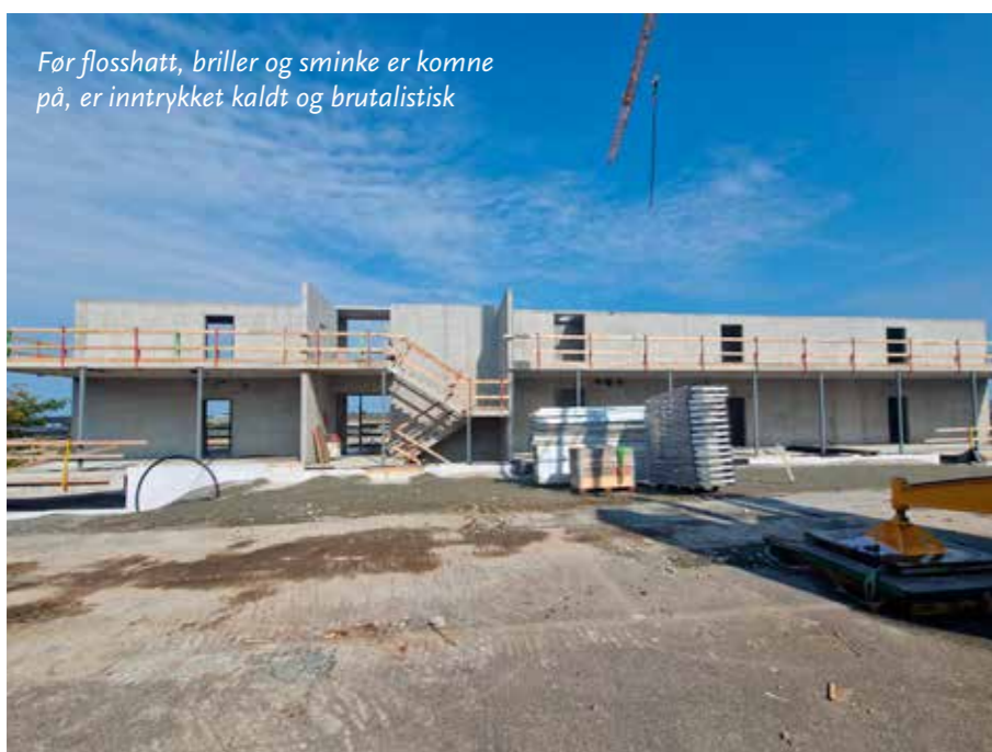
Før flosshatt, briller og sminke er komne på, er inntrykket kaldt og brutalistisk