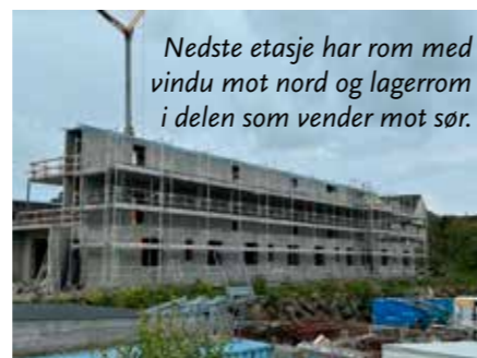
Nedste etasje har rom med vindu mot nord og lagerrom i delen som vender mot sør.