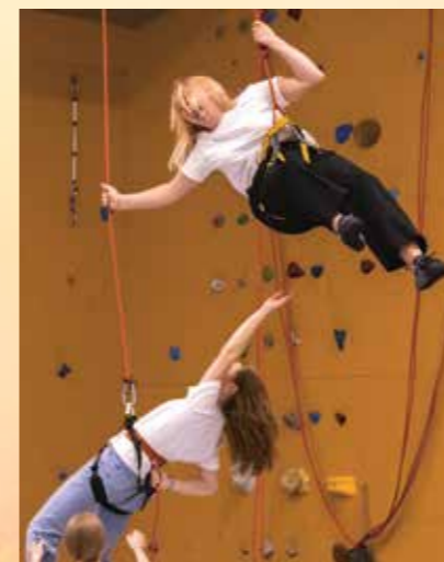
Den nye klatreveggen ble også flittig brukt.