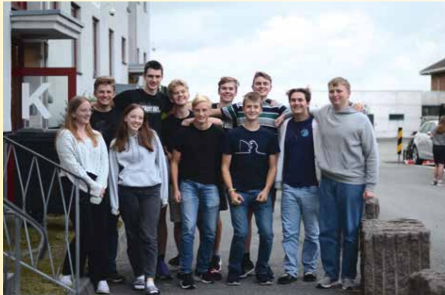
Nye Vg2- og Vg3-elever – og noen «gamle» som nå er lærlinger – var glade for å se hverandre igjen på åpningslørdagen.