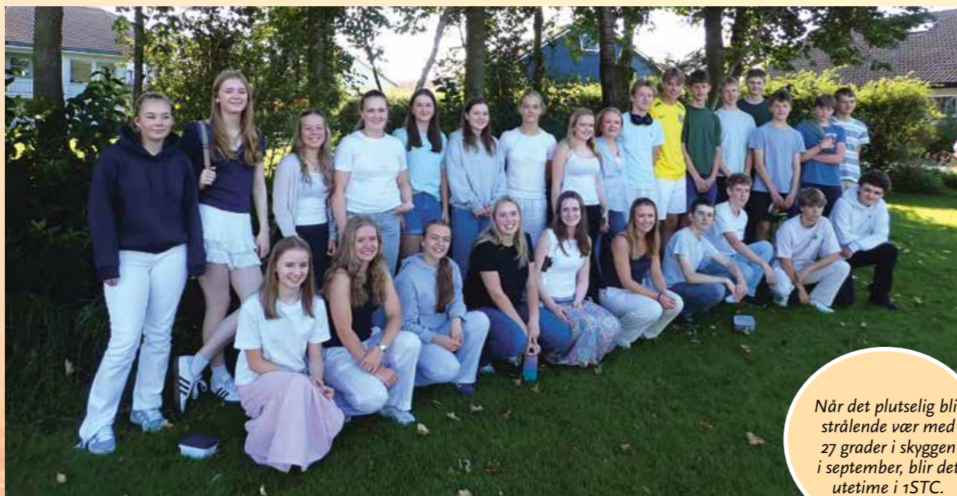
Når det plutselig blir strålende vær med 27 grader i skyggen i september, blir det utetime i 1STC.