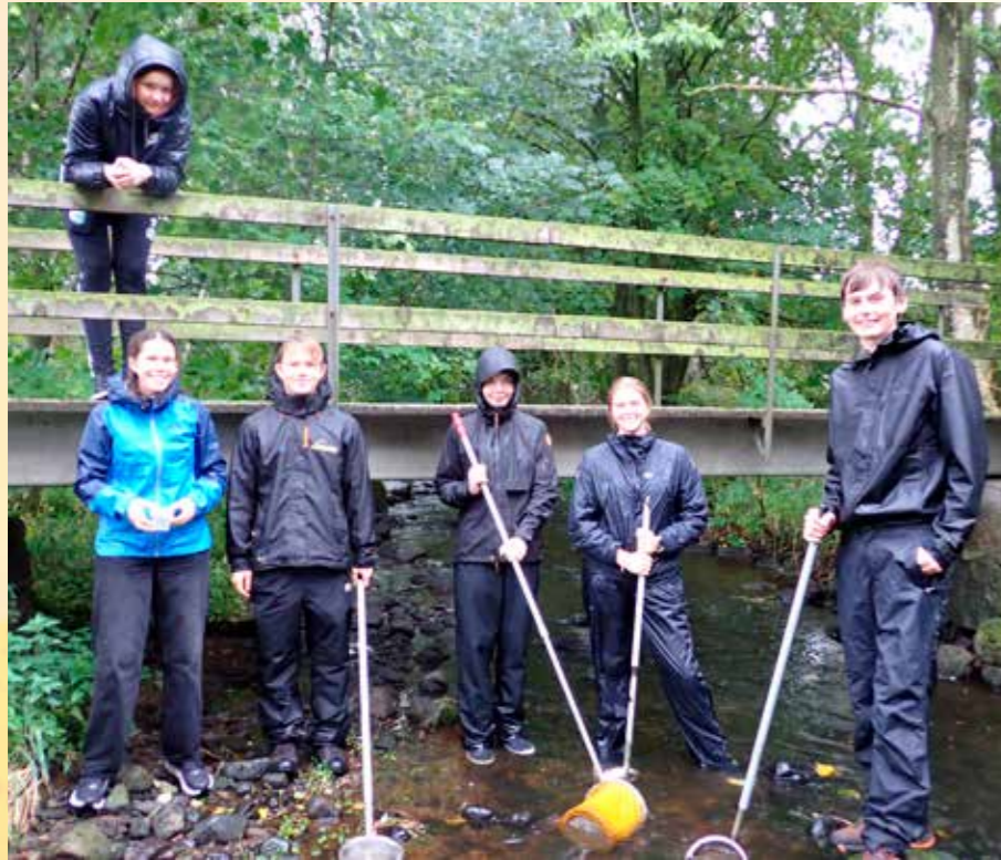
En regnfull dag i slutten av august var 3BI-elevene på feltarbeid i Skjerpebekken på Nærbo.