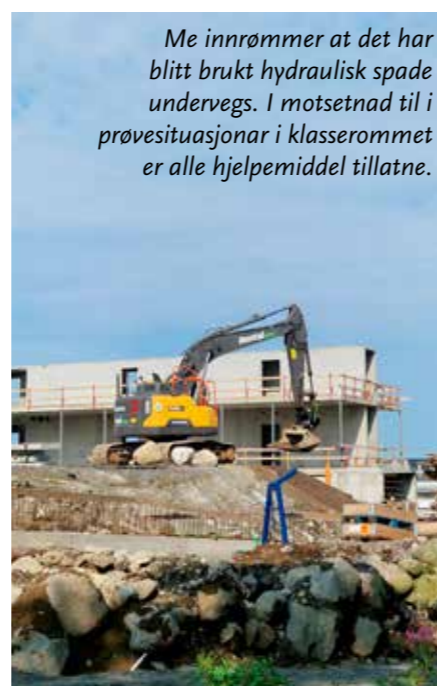
Me innrømmer at det har blitt brukt hydraulisk spade undervegs. I motsetnad til i prøvesituasjonar i klasserommet er alle hjelpemiddel tillatne.