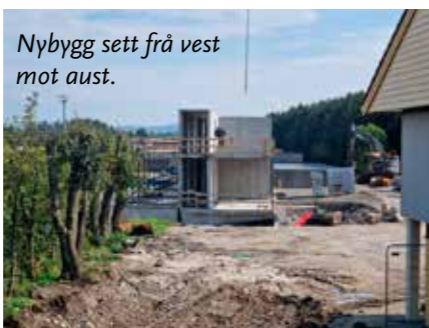
Nybygg sett frå vest mot aust.