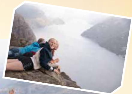
Tradisjonen tro ble det også i år tur til Preikestolen en uke etter oppstart.