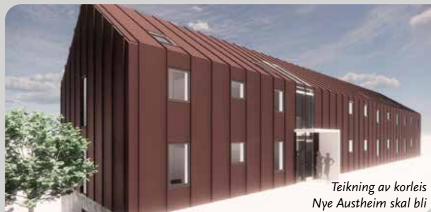
Teikning av korleis Nye Austheim skal bli

Gamle Austheim skal som kjent rivast, tidspunktet er ikkje fastsett, men i løpet av kommande vår sender skulen ut anbod for nytt undervisningsbygg som skal stå der gamle Austheim nå står. Tilbudsprisane frå anbudsgivarar vil så bli avgjerande for kor raskt riving og nytt byggeprosjekt kan kveikast i gang.