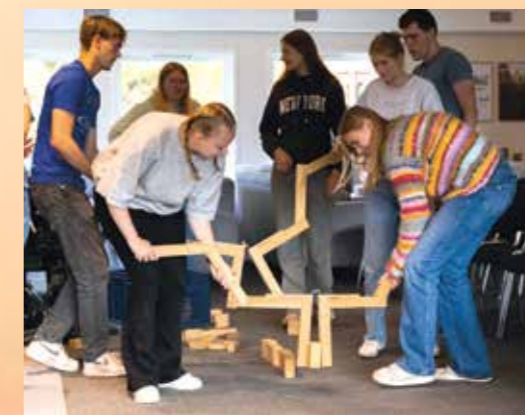
Godt samarbeid er viktig.