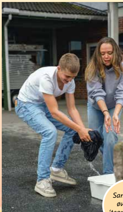
Samarbeids- øvelser og 'teambuilding'.