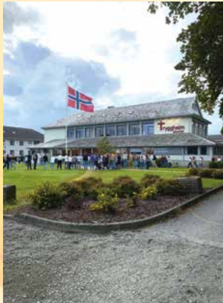
Lørdag 17. august var første skoledag for Vg1-elevne.