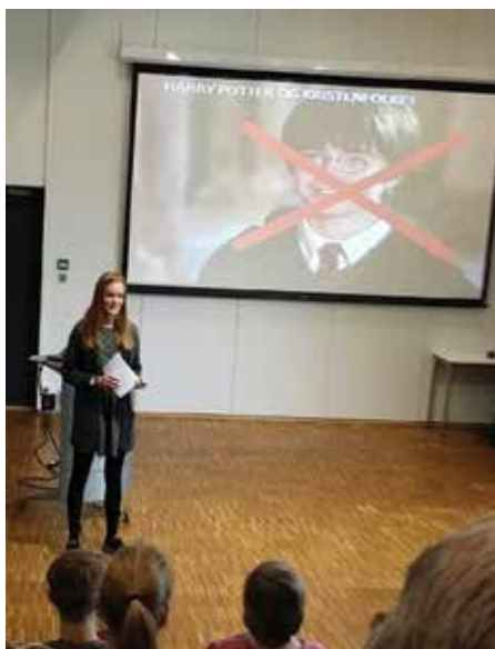
Harry Potter-bøkene har ikkje alltid vore populære hos kristenfolket.

- Kvifor valde du å vera med på fordjupingsmeisterskapen? - Eg synest det er kjekt å ha framføring, og dessutan var det ei utfordring eg hadde lyst til å ta. Så ler ho litt og hevdar at det var mest for å få stjerne i boka, utan at ho går noko nærmare inn på kva det betyr. I salen på Bryne sat mellom anna familie og vener. - Korleis opplevde du dagen på Garborgsenteret?