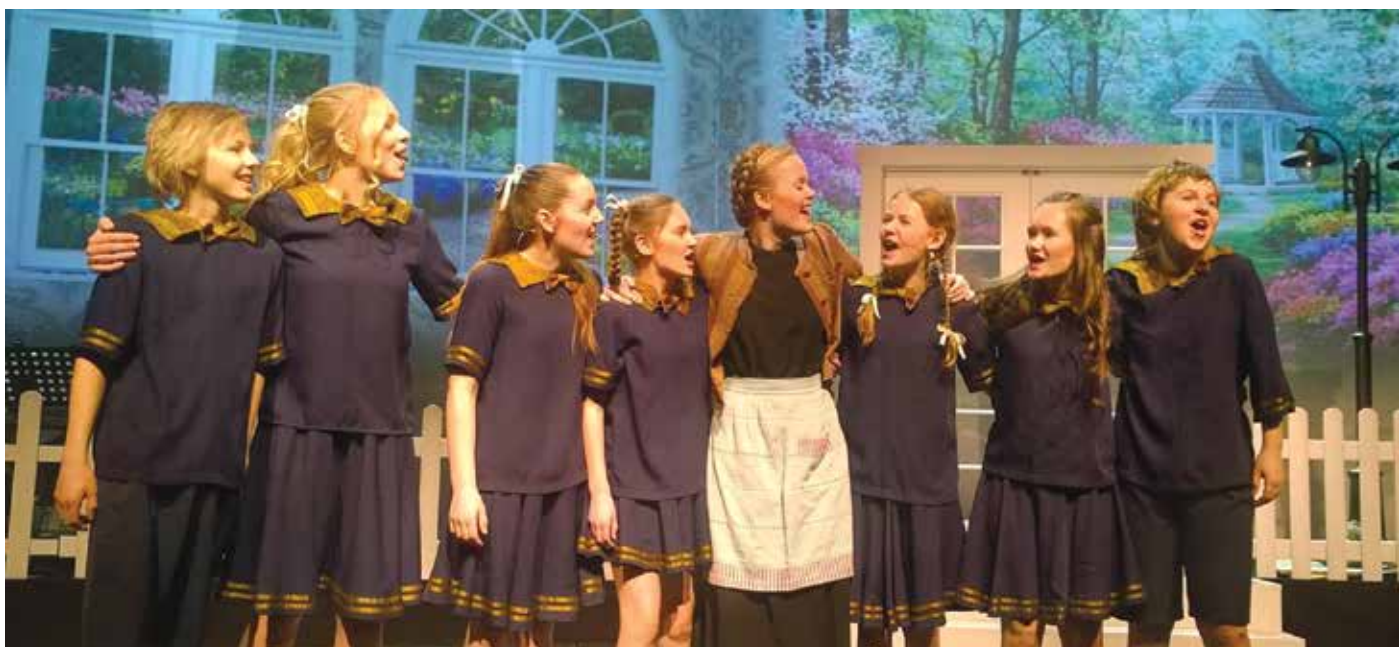
Alle «von Trapp-barna» sammen med «Maria» – en stor overvekt av Tryggheimelever blant aktørene!