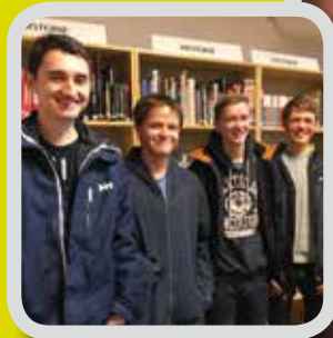
Temadag på Tryggheim