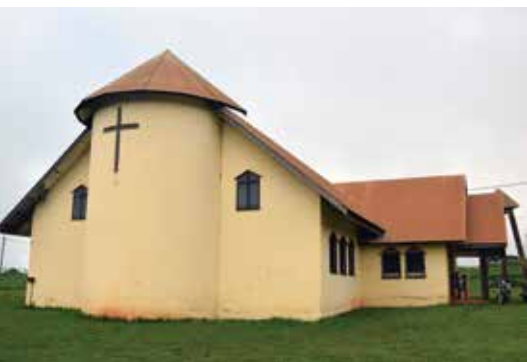
NLM-støtta kyrkje i ein landsby nord i Efenbeinskysten.

Nord i Efenbeinskysten driv NLM evangeliseringsarbeid i ei muslimsk folkegruppe. For eitt år sidan etablerte ein ung misjonærfamilie seg der, etter at NLM hadde vore borte frå området på grunn av borgarkrig og uro frå 2004 (ein familie var der eit halvt år i 2013). I den tida NLM har vore ute av området, har lokale medarbeidarar drive kyrkja i byen.