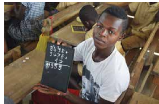
Maniga på speed school i Abidjan.

Likevel er misjonærane her glade for å kunna arbeida i desse områda. Folk her treng også å høyra evangeliet om Jesus, dei treng også ein frelsar som vil gå i lag med dei gjennom liv og død. Ver med og be for folket og for misjonærane, om at det kan bli