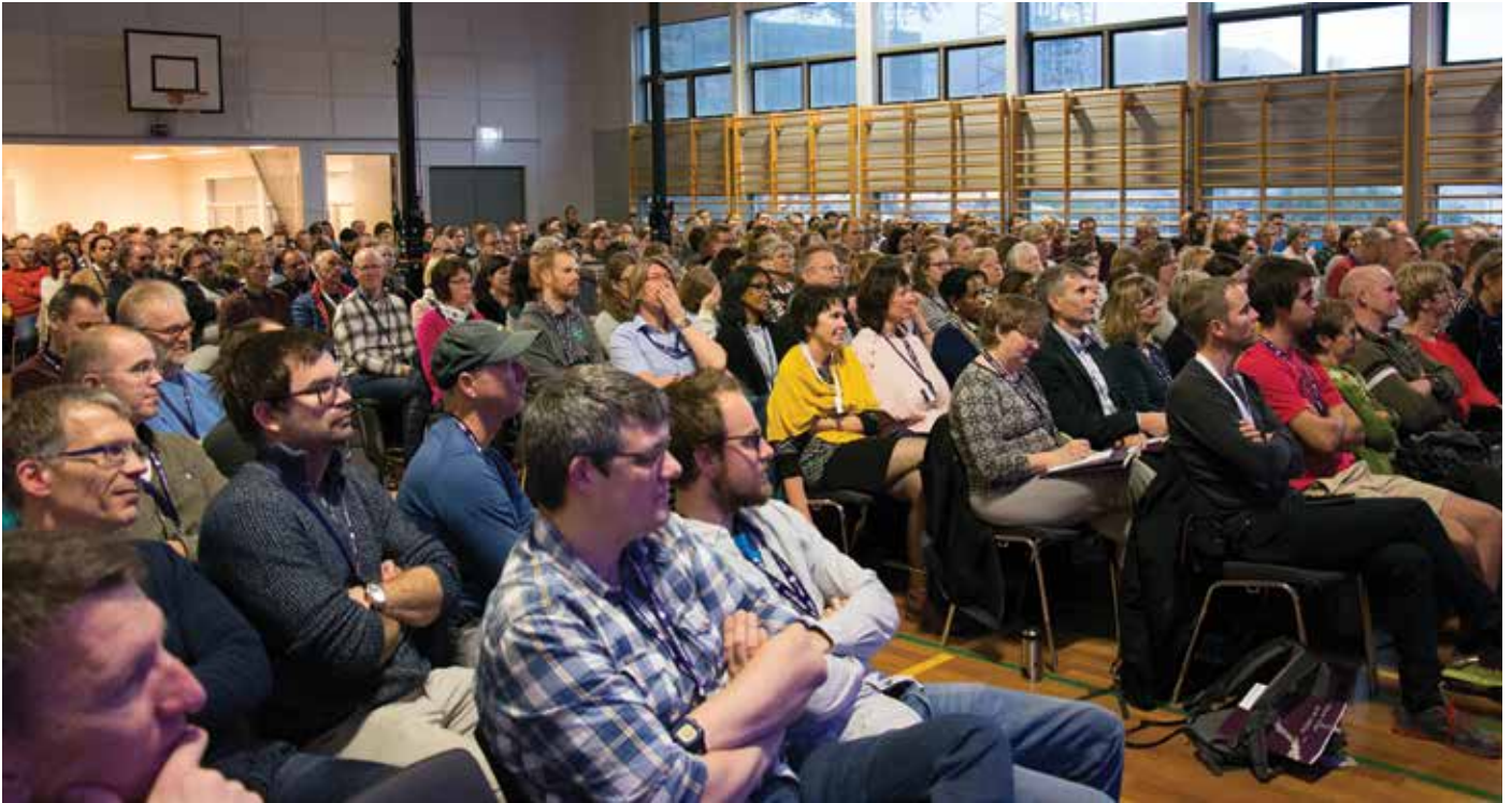
Gymsalen på Lundeneset var fylt til siste sete av NLMvgs-tilsette.