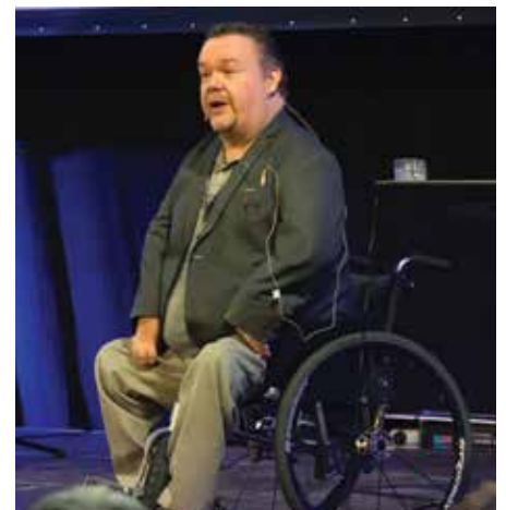
Paralympiaren David Lega.

I tillegg pleidde gode og stadige måltid og kaffipausar både lekam, venskap og kollegialt fellesskap gjennom heile konferansen. Samlinga vart ein ny kveik i verdas viktigaste jobb.