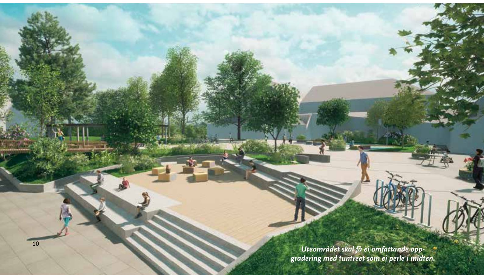
Uteområdet skal få ei omfattande oppgradering med tuntreet som ei perle i midten.

Det har lenge vore eit behov for oppgradering og utviding av undervisningslokala her på Tryggheim vgs., og med eit aukande elevtal blir dette behovet berre større. Sjølv om Austheim har vore ein trufast tenar i mange år, ser me dessverre at bygget er modent for utskifting. Austheim