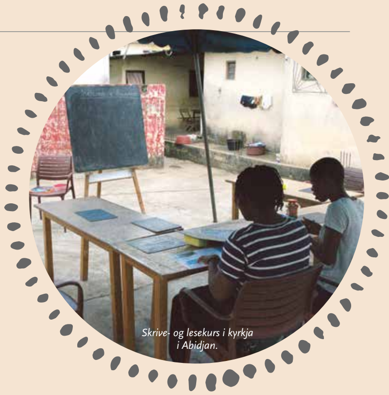
Skrive- og lesekurs i kyrkja i Abidjan.