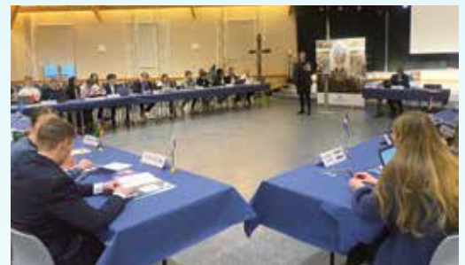
FN-spillet – et lærerikt og engasjerende prosjekt!

I forbindelse med FN-dagen og temaet «internasjonalt samarbeid» i samfunnsfag på 10. trinn, fikk vi besøk av FN-sambandet onsdag 31. januar. Elevene hadde kledd seg opp, skrevet på åpningstaler, og forberedt seg på dagens mål; nemlig å forhandle frem fredsløsning i Mali-konflikten.