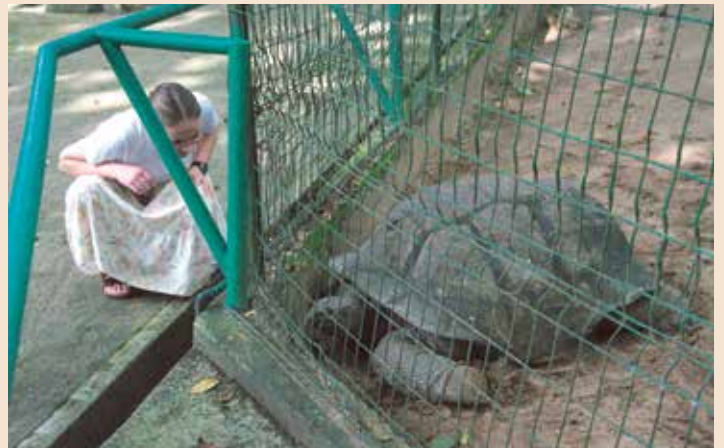
Denne skilpadda skal ha levd sidan andre verdskrigen. Etter seiande har ho eit skothol i pannen.