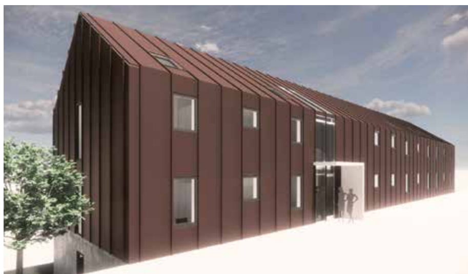
Det nye internatbygget er inspirert av dei mange løene ein kjenner igjen frå kulturlandskapet Jæren.

I disse dagar er det store byggeplanar på Tryggheim vgs., og me arbeider med ein omfattande plan for omorganisering, ombygging og nybygg som me har valt å kalla Tryggheim 2030. Første ledd i planane er å setja opp nytt internat, nytt undervisningsbygg der Austheim står i dag, og oppgradering av uteområdet, alt teikna av Stav Arkitekter.