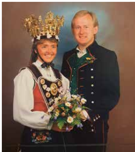
Eit flott brurepar i 1988 med bunader og krone.

Tryggheim er ein kristen skule. Å gje elevane innsyn i kva nåden inneber, er det viktigaste me kan gjera. Sjølv sagt skal me ha ein god skule undervisningsmessig, og sjå den enkelte eleven. Når personalet har eit felles menneskesyn, er det mykje lettare å samarbeida. Av og til når eg har snakka med folk utanfor skulen, t.d. PP-tenesta og Rogaland fylkeskommune, har eg sagt at det er flott å sjå at menneskesynet vårt verkar.