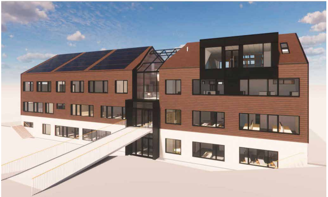
Undervisningsbygget er teikna med fleksible romløyningar som i større grad legg til rette for ei variert undervising.

skal difor få takka av etter mange års teneste, og eit nytt undervisningsbygg skal setjast opp der Austheim står i dag.