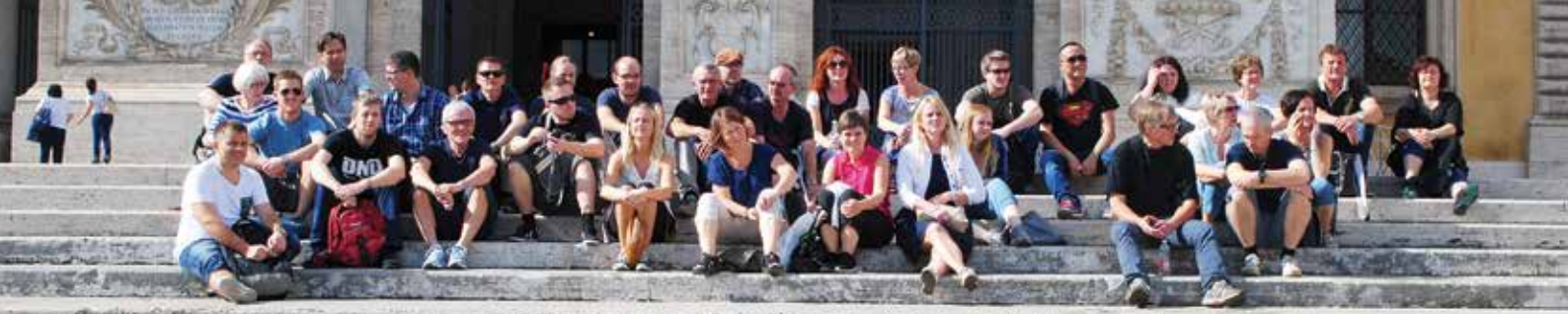
Reisefølget utenfor Lateranet, Johanneskirken. Kristenhetens sentrum i 1000 år. Denne var pavens residens frem til eksilet i Avignon.

Personalet ved Tryggheim vgs har dette året vært på to flotte personalturer – først for de som ønsket tur til Israel i vår, og deretter for de som ønsket tur til Roma i høst.