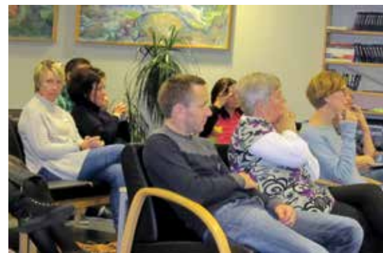
Interesserte tilhøyrarar på seminar.

Eg trur me går oppmuntra tilbake til kvardagen, vel vitande om at me har ei viktig og meningsfull oppgåve blant ungdommen. Gud har ikkje bruk for våre gode gjerningar, men det har dei me omgåast. Me ber med Petter Dass for oss sjølv og elevane våre: La lykkjes Jesu navn, så vi vår vei kan finne inn i din faderfavn.