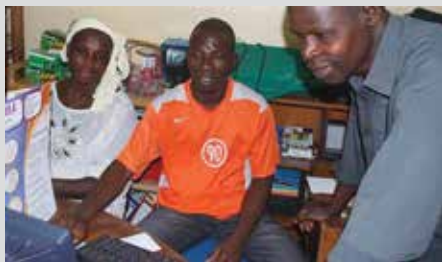
Radioarbeid er en viktig del av evangeliseringen i Elfenbenskysten.

Ved siden av bistand er evangelisering et satsingsfelt med blant annet nyplanting av menigheter, utrustning av nasjonale ledere, radioprogrammer og arbeid med bibeloversettelse til mahoufolket. Flesteparten av mahoufolket har ikke hørt evangeliet om Jesus. De få som har det, må ofte leve i stillhet med sin tro på grunn av forfølgelse. Men radioprogrammet Mahourøsten bryter stillheten og gir oppmuntring og håp. Gjennom undervisning, radioteater og kristen sang forkynnes evangeliet om Jesus til mahoufolket ukentlig på radio. NLM samarbeider med organisasjonen Wycliffe om oversettelse av Bibelen til ma-