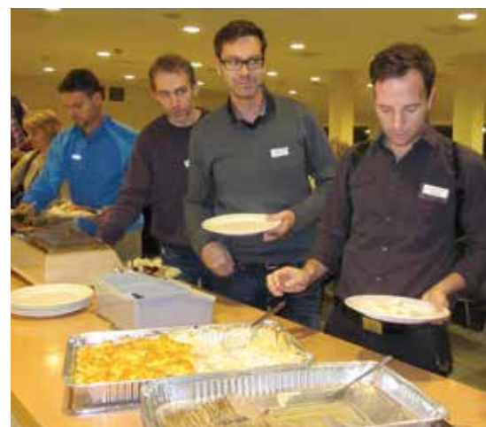
Steik og fløtegratinerte poteter stod på menyen torsdag kveld.