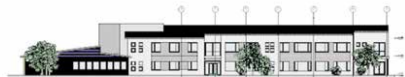
Slik vil truleg Tryggheim ungdomsskule sjå ut om eit par år.